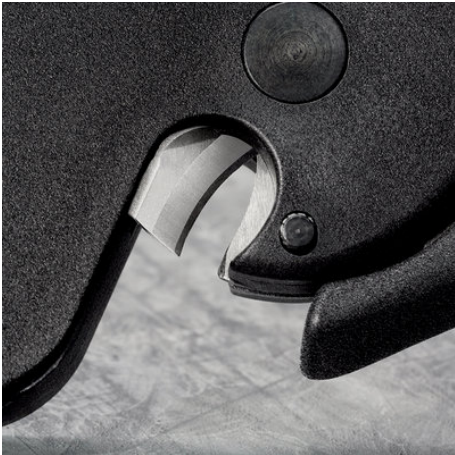
Mit Kabelschneide für Leiter bis 10 mm 2