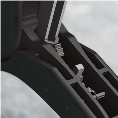
Die Zwangssperre stellt beim Crimpen immer den perfekten Anpressdruck sich